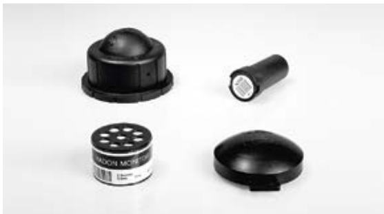
Bild 3 Beispiele von Radondosimetern.