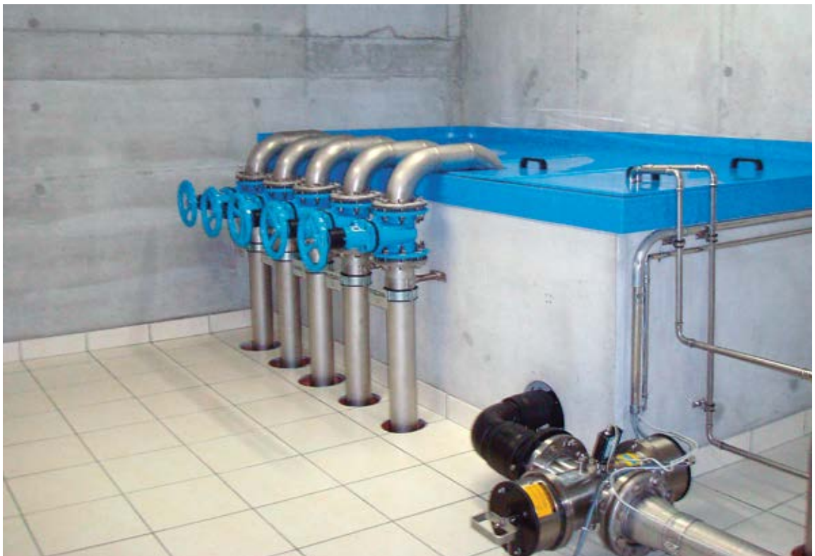
Bild 4 und 5 Radon wird mit speziellen Einrichtungen aus dem Wasser entgast.