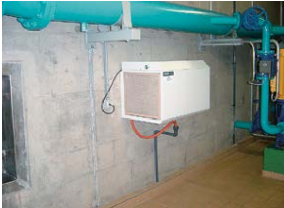
Bild 2 Entfeuchtungsgerät mit Filter, wo sich die radioaktiven Zerfallsprodukte von Radon ansammeln können.

Eine weitere Gefahr sind die Filter von Belüftungs- oder Entfeuchtungsgeräten (Bild 2): Da die radioaktiven Zerfallsprodukte an Schwebeteilchen in der Luft haften, werden sie von den Geräten angesaugt und im Filter gesammelt. Wird mit den Filtern hantiert (z.B. Filterwechsel), kann sich die betreffende Person kontaminieren und die radioaktiven Stoffe aufnehmen.