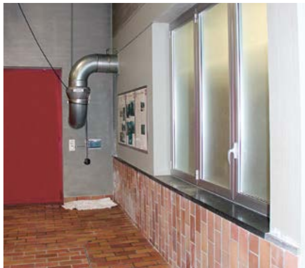
Bild 6 und 7 Räume mit erhöhten Radonkonzentrationen werden luftdicht verschlossen.