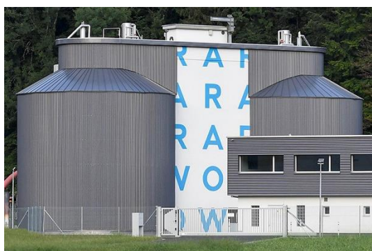
ARA Sarneraatal, Alpnach OW