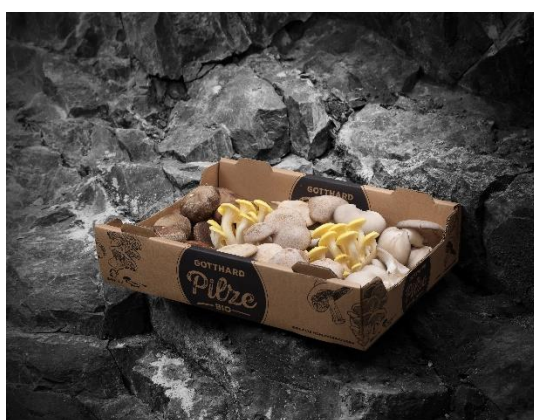
Gotthard BIO Pilze AG, Stansstad NW